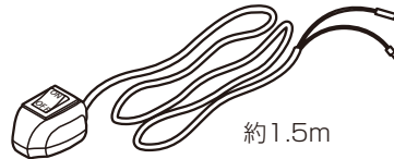
ハザード入力キャンセルスイッチ (1)